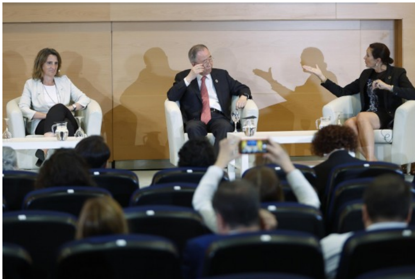
La vicepresidenta tercera del Gobierno y ministra de Transición Ecológica, Teresa Ribera (i) junto con el exsecretario general de Naciones Unidas, Ban Ki-moon (c) y la Copresidenta del Club de Roma, Sandrine Dixson-Declevè (d).