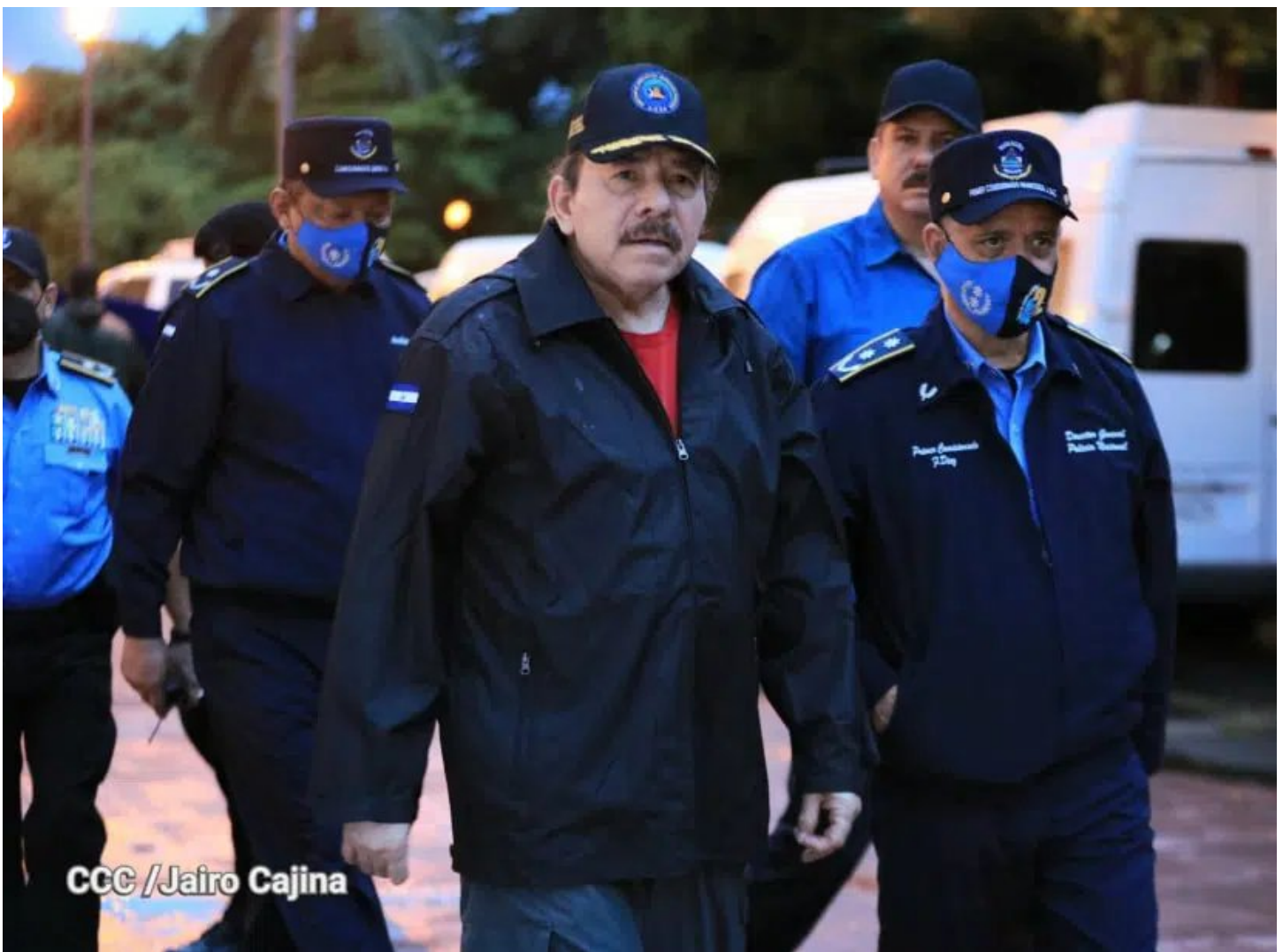
CCC / Jairo Cajina