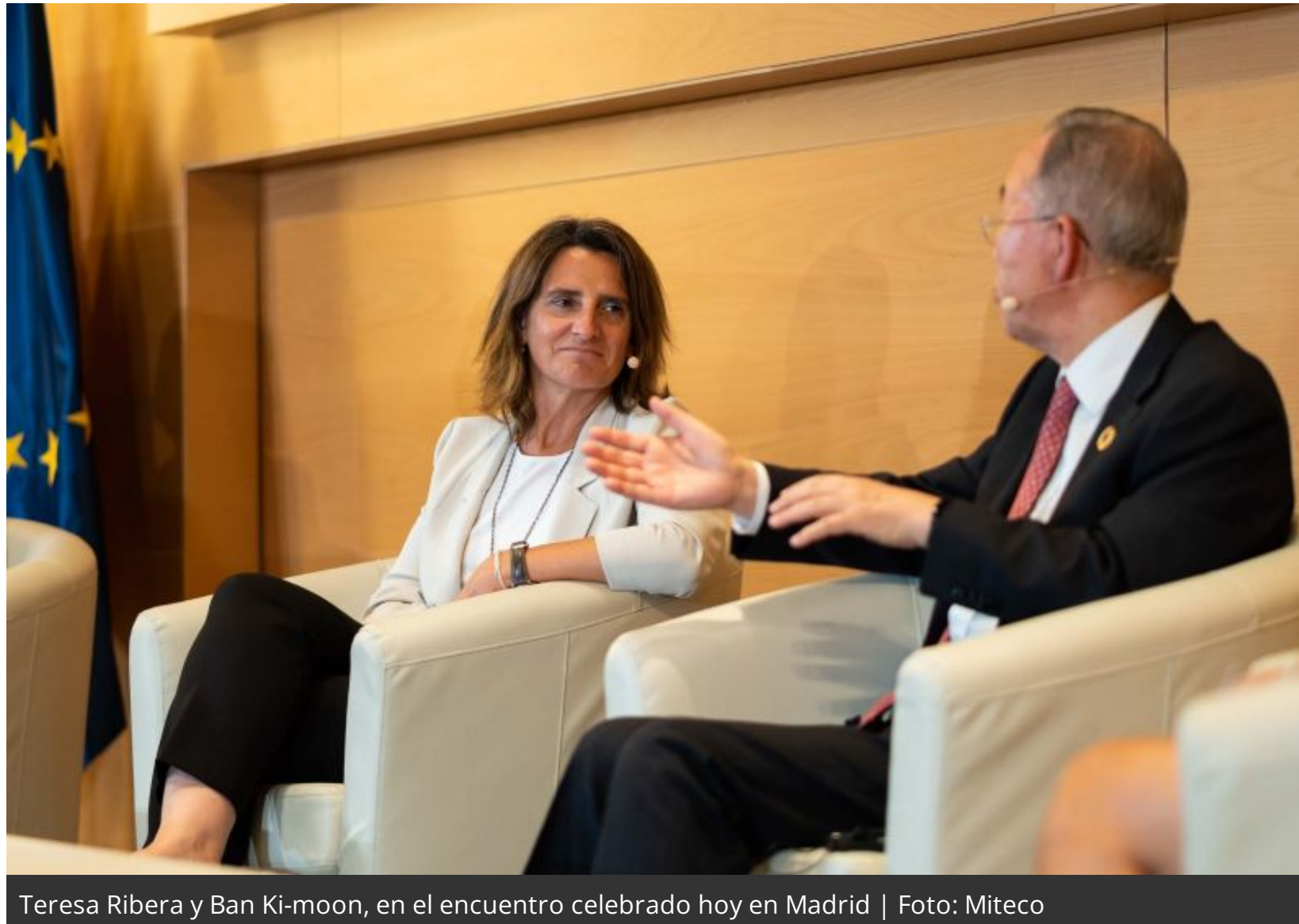
Teresa Ribera y Ban Ki-moon, en el encuentro celebrado hoy en Madrid

- Ban Ki-moon pide en Madrid redoblar los esfuerzos para contener el calentamiento por debajo de 1,5 grados