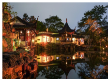
Suzhou : le jardin du Maître des filets propose de riches programmes lors de visites nocturnes