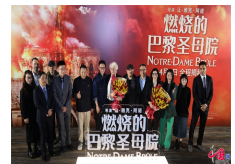
Sortie en Chine du film catastrophe Notre-Dame brûle de Jean-Jacques Annaud