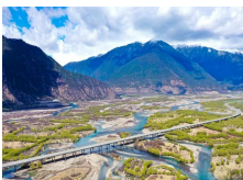
Tibet : la beauté du parc national des zones humides de Yani