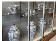
La céramique, un lien pluriséculaire entre la Chine et la France