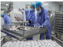
Hebei : développement de la chaîne industrielle des châtaignes pour aider les agriculteurs à augmenter leurs revenus