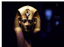
Vernissage à Paris d'une exposition intitulée « Ramsès et l'or des Pharaons »