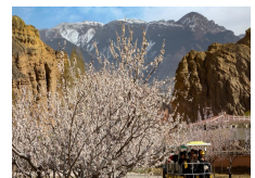
La beauté printanière du parc géologique national de Gui'de