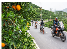
Hubei : le tourisme caractéristique aide à la revitalisation rurale au xian de Zigui