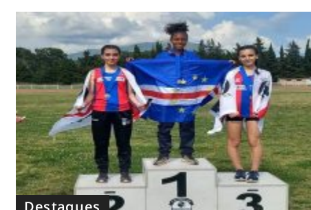
Cabo Verde é Ouro nos Jogos das Ilhas em Córsega, França