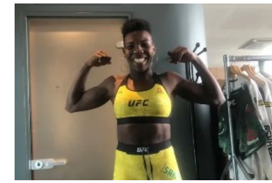
De pelear en la UFC a malvivir en las calles: "Me prostituyo por un cigarrillo" MARCA

"Veo una China muy abierta al mundo" , soltó en una entrevista con el diario oficial del PCCh el pasado septiembre desde Pekín el presidente autonómico andaluz, Juanma Moreno, que se volvió a España con el compromiso de 2.500 millones de euros de inversiones industriales para seis provincias andaluzas, sobre todo para proyectos de renovables.