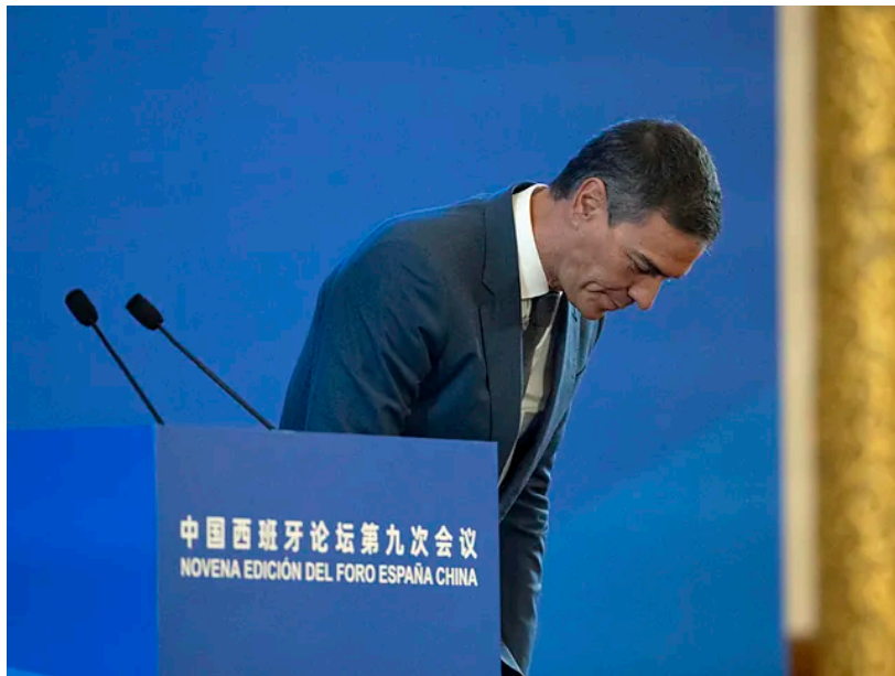
El presidente español, Pedro Sánchez, en un foro en Pekín.