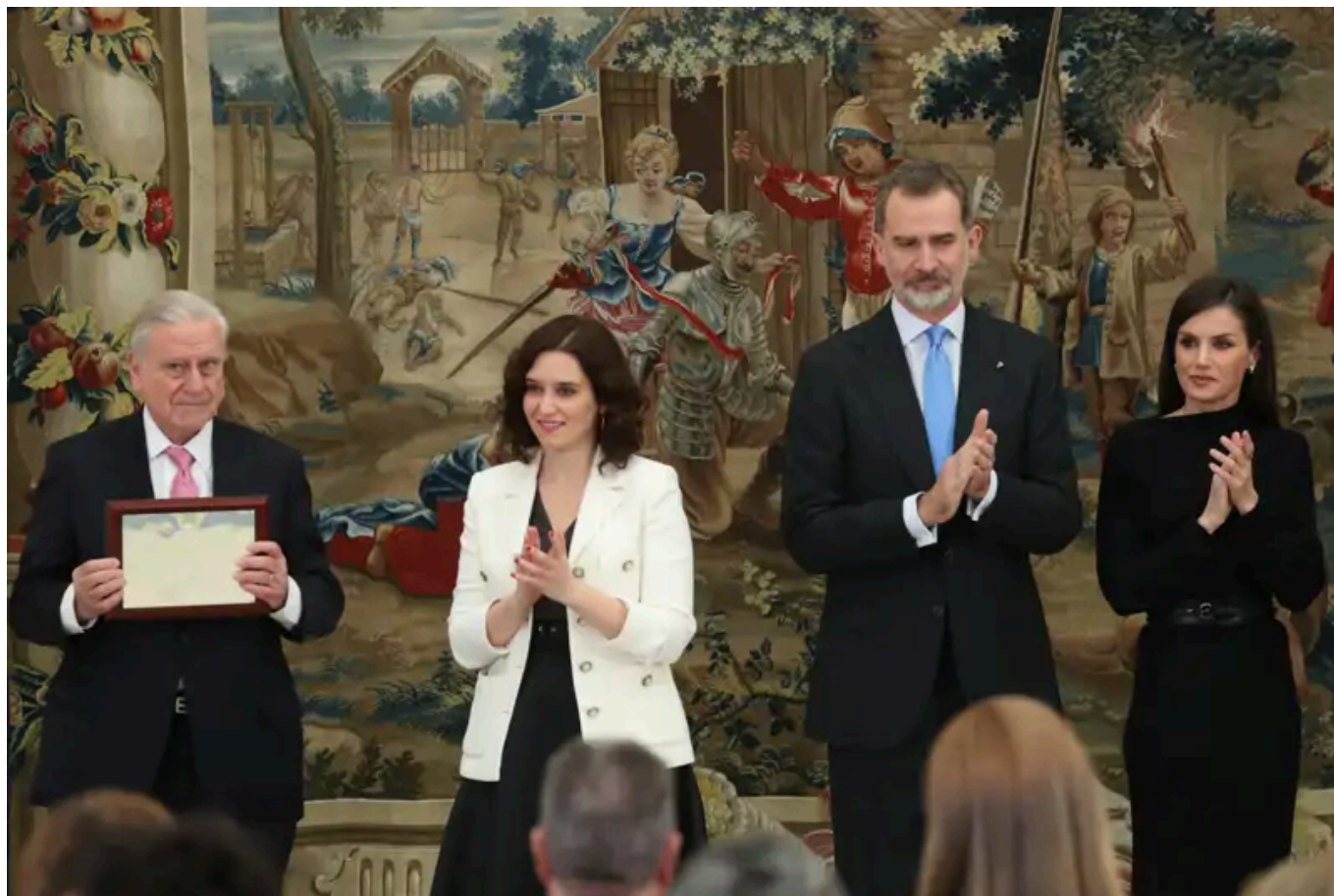
El doctor Valentín Fuster recoge un galardón durante una ceremonia presidida por los Reyes Felipe y Letizia

No será hasta el miércoles, día 24, cuando el Rey y la Reina acudan a su primer acto conjunto. De hecho, tendrá lugar en el Palacio de la Zarzuela . Allí, se reunirán con los miembros de los Patronatos de la Fundación Princesa de Asturias.