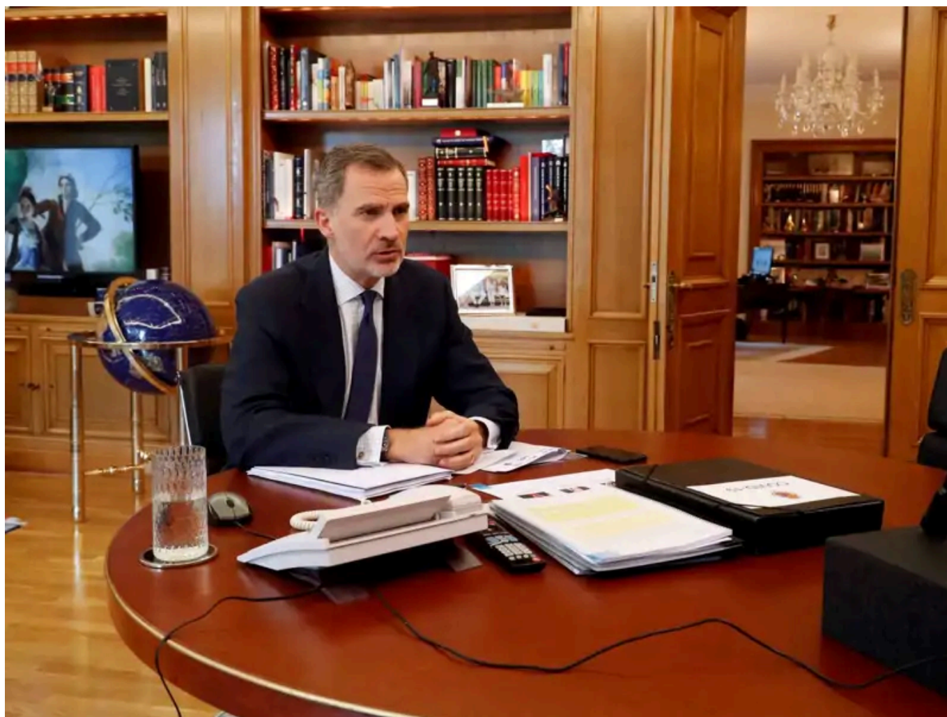
El despacho de Felipe VI.

Hay que subir a la segunda planta para vislumbrar las salas de trabajo de Sus Majestades. Es en sus despachos donde Felipe y Letizia pasan buena parte de su tiempo mientras permanecen en Zarzuela.